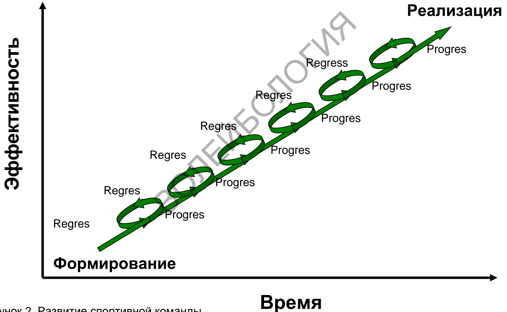
Рисунок 2. Развитие спортивной команды